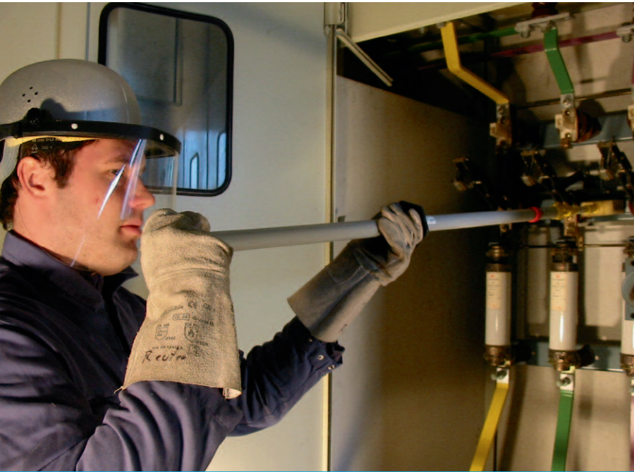
Arbeit unter Hochspannung