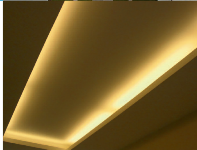
Effektvolle Beleuchtung und Heimkino im Privathaushalt

Wenngleich Böhm Elektrobau die Errichtung von elektrischen Neuanlagen, die Durchführung von Netzanalysen, sicherheitsrelevante Prüfungen oder die Planung und Installation von Kommunikationssystemen gerne zu Tagzeiten durchführt: An 365 Tagen im Jahr und 24 Stunden täglich ist Böhm Elektrobau erreichbar und mit einem von 8 Einsatz- und Werkstattfahrzeugen im Störfall schnell bei seinen Kunden vor Ort. Da wird Nähe zum Alleinstellungsmerkmal.