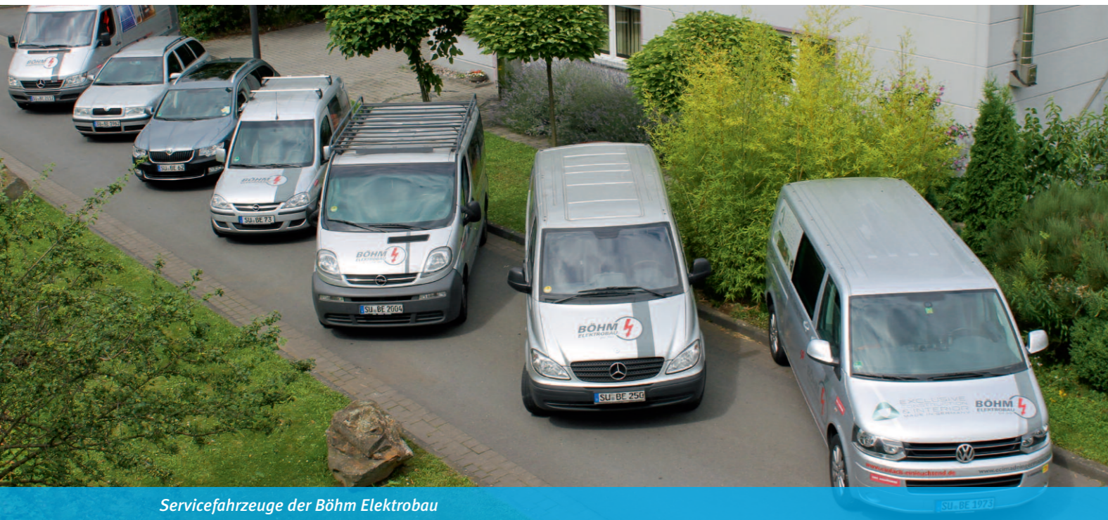
Servicefahrzeuge der Böhm Elektrobau