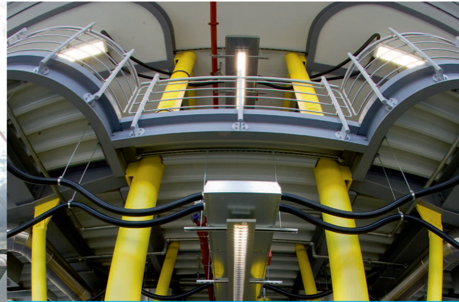
Außergewöhnliche Elektroinstallationen wie bei Iglas in Köln-Lind kennzeichnen die Leistungsfähigkeit des Unternehmens

Und so installieren die Monteure große, in die Wand eingelassene Touchscreens für die Steuerung der Gebäude ihrer Kunden. Diese regeln dann per Fingertipp den Rolladenantrieb, die Alarmanlage oder Heizung. Auf Wunsch auch von unterwegs: nach ein paar Klicks auf dem passenden Smartphone läuft zu Hause schon mal die Heizung an, schafft wohlige Wärme zur rechten Zeit und trägt damit neben einem Komfortgewinn auch zur Energieeinsparung bei.